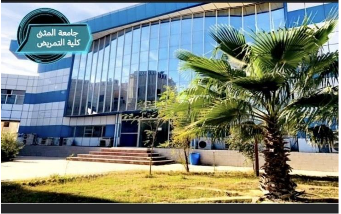
كلية التمريض-جامعة المنيا